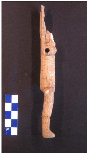
تصاویر ۱ و ۲ :